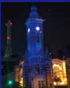
横浜市開港記念会館