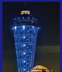
江の島シーキャンドル