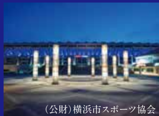
(公財)横浜市スポーツ協会 日産スタジアム