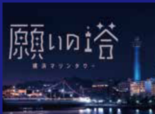
横浜マリンタワー