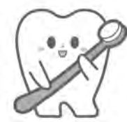
3-4歳児では保育園や幼稚園での受傷が多くなります。

乳歯の外傷は、その多くが転倒によって引き起こされますが、口腔領域は全身の面積の1%程度でありながら、口腔外傷は治療を必要とする身体外傷の5%を占めていると報告されています。口腔外傷は、体面積当りからみた受傷頻度としては最も高いといえます。そして、口腔外傷の約90%が歯の外傷になります。とくに、乳歯の外傷では、受傷歯のみならず、後継永久乳歯が抜けた後に生えてくる永久歯)への影響がみられることがあるため、慎重な対応が必要になります。