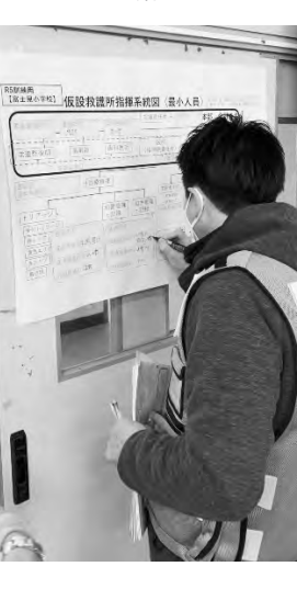
11月28日(日)小田原市仮設救護所設置訓練に参加