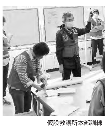
本部通信訓練を前にMCA無線の操作確認