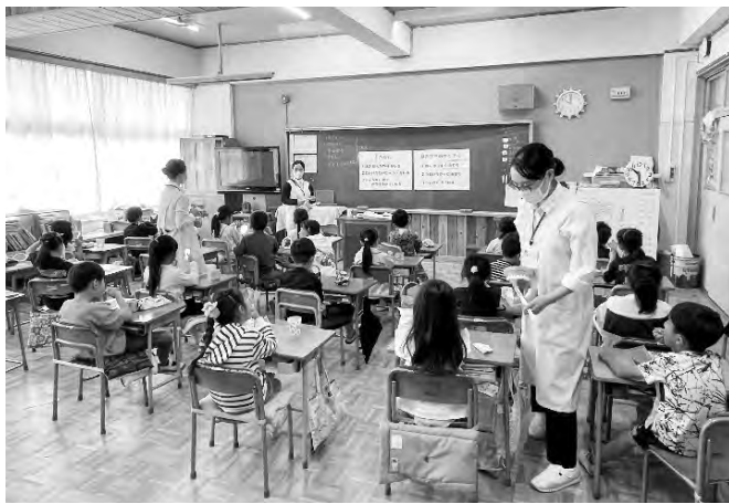
歯科衛生士学生によるきめ細かい指導

また、朝起きてすぐの口臭は、そのほとんどが生理的の口臭ですが、毎日のように起こる場合は口呼吸が原因である可能性があります。口呼吸が起これば、口の中が乾燥し、舌の裏側に細菌が繁殖しやすくなり、口臭の原因がアレルギー性鼻炎など